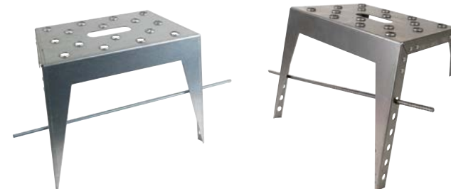
Je nach Gelände und Gefälle am Hang wird das Moniereisen gerade oder schräg eingeschoben.