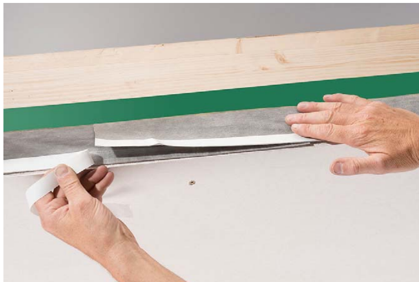
DOLLE Deckenanschlussband, die Enden 10 bis 15 cm überlappend, verkleben