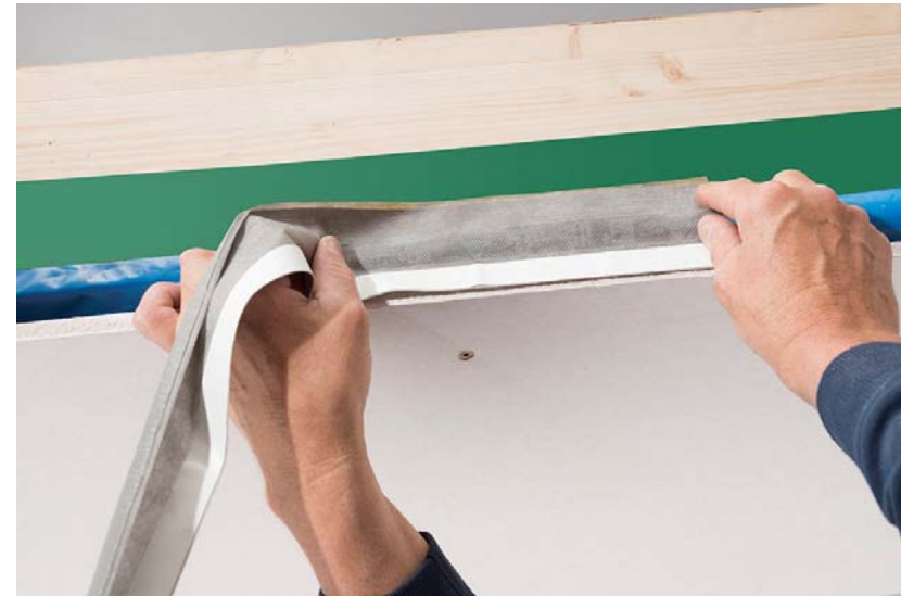
DOLLE Deckenanschlussband umlaufend, deckenbündig verkleben