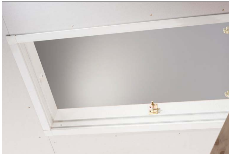
Kasten komplett eingebaut.