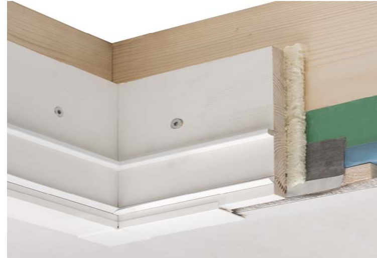
Spalt zwischen Lukenkasten und Decke durchgehend dämmen.