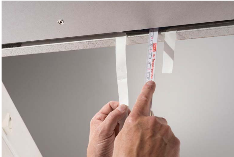
DOLLE Deckenanschlussband an den Kasten andrücken, Schutzstreifen weiterlaufend abziehen.